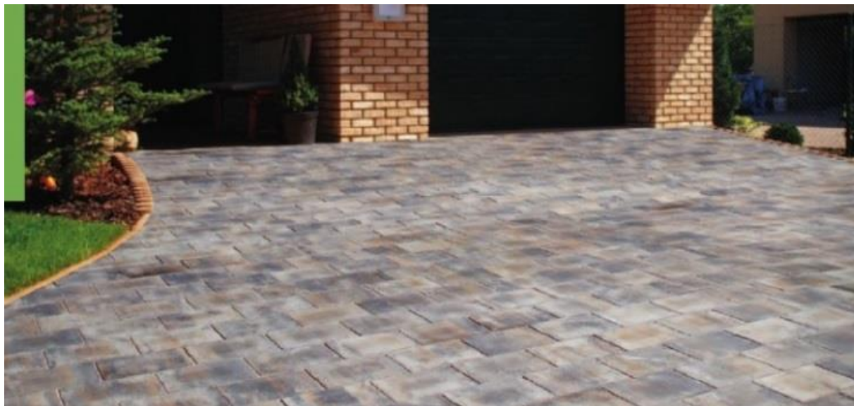
Dlažba na sjezdech v rámci SO 101 – velikost 140x210x80mm, barva colormix arabica, kladení na vazbu