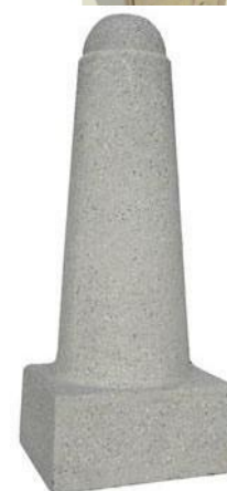
Navrhovaný typ sloupku

Přesná poloha sloupků je vyznačena v situaci.